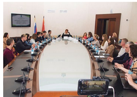
Круглый стол о проблемах малого бизнеса

В мае муниципалитет организовал серию обучающих семинаров для самозанятых граждан и представителей малого бизнеса, одним из которых стал круглый стол «Самозанятость и малый бизнес в современных реалиях. Как выжить и вырасти?». Начинающие предприниматели и те, кто только мечтает открыть свое дело, узнали, какие возможности для развития и поддержки бизнеса существуют и как ими воспользоваться.