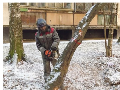
Рубка сухих и аварийных деревьев

продолжены весной 2023 года. Работы в муниципальных скверах уже начались. Подрядчик удаляет порослевые и самосевные побеги. Спиливает ветви, нависающие над пешеходными дорожками. Всего в контракт вошло 918 кустов.