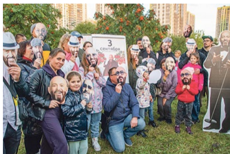
Праздник «Костры рябин»