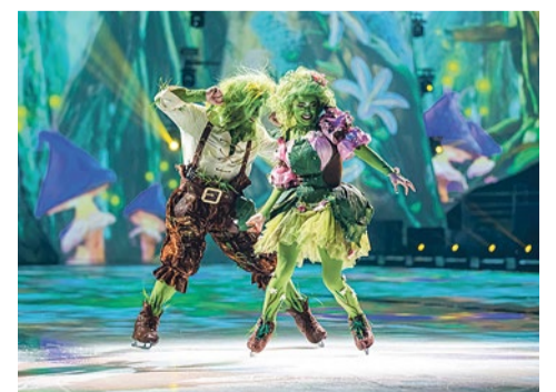
Мюзикл на льду «Спящая красавица»