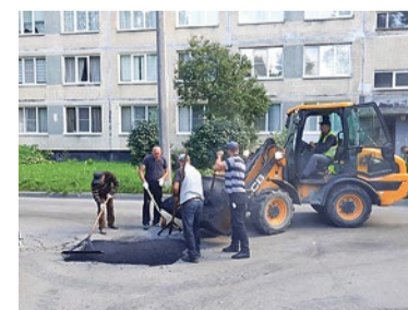
Ямочный ремонт на улице Турку