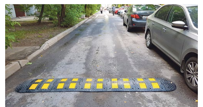
Установка искусственных дорожных неровностей и ограничителей парковок