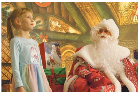
Приемная Деда Мороза

Проведение любого культурного мероприятия – это огромная работа многих специалистов. МО № 72 готовится ко всем праздникам вдумчиво, ответственно и с душой, чтобы каждый праздник становился важным событием, пусть не городского, но нашего, родного и близкого масштаба. Приятно видеть веселые, улыбающиеся лица жителей – это лучшая награда за работу!