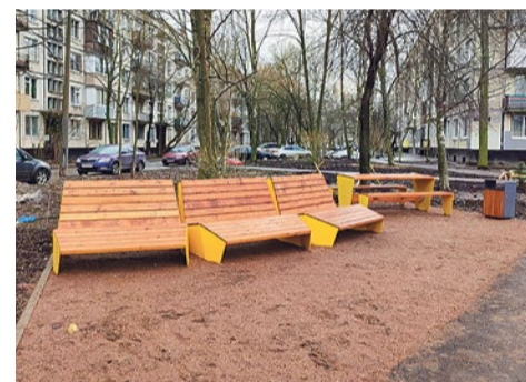
Зона отдыха на Софийской, 35/4