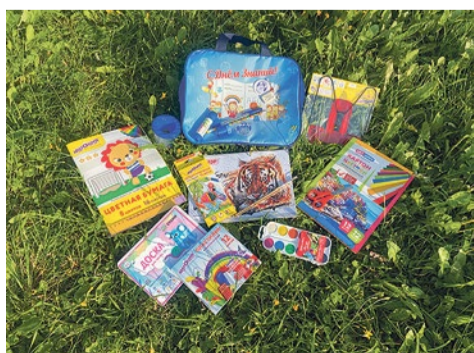
Подарочные наборы первоклассникам

Еще одна добрая традиция – дарить подарки. К 1 сентября все первоклассники получили подарочные наборы для учебы и творчества. Также муниципалитет закупает цветы и подарки для юбиляров от 75 лет и юбиляров супружеской жизни, новогодние подарки для опекаемых детей.