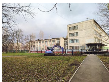
Строительство дорожек перед школой № 296