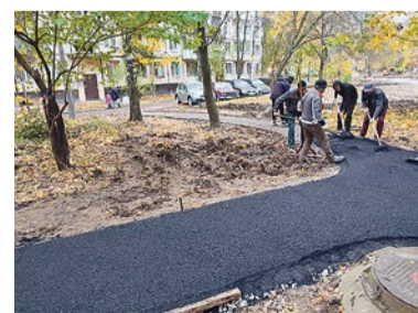
Строительство пешеходной дорожки на Софийской, 35/4

материалами. В течение года дважды была произведена замена песка в 56 песочницах, завезено 120 кубометров земли, убрано 11,6 кубометра бетонного мусора, заменено 100 секций газонного ограждения, 154 секции отремонтировано. Осенью было отремонтировано 1887 м 2 дорожек из гранитной крошки.