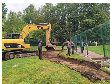
Ремонт пешеходных дорожек на Празжской, 22