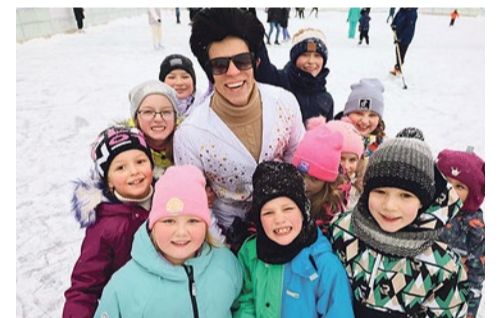
Зимние забавы на льду