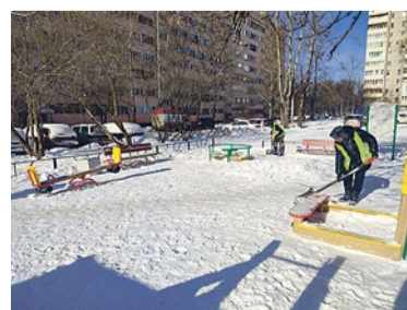
Уборка снега на детской площадке