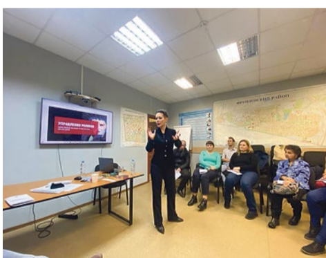
Полезные вечера в муниципалитете № 72