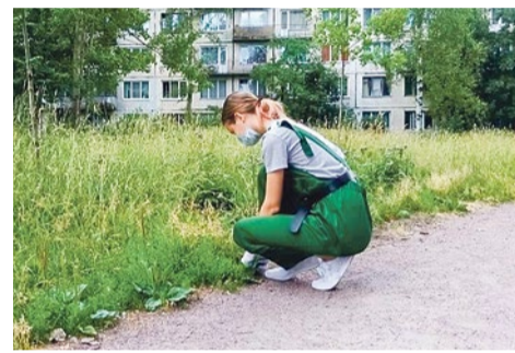
Летнее трудоустройство подростков

округа работой. Рабочий день длился всего четыре часа, в течение которых ребята занимались благоустройством муниципальных скверов.