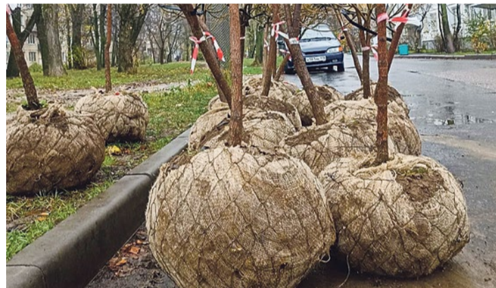
Посадка ив на Турку, 24/2

проекта Лесотехнического университета «Газон как индикатор состояния устойчивой городской среды и адаптации к изменениям климата». Участники эксперимента будут следить за состоянием каждой площадки, оценивать ее состояние, эстетический вид, видовое разнообразие