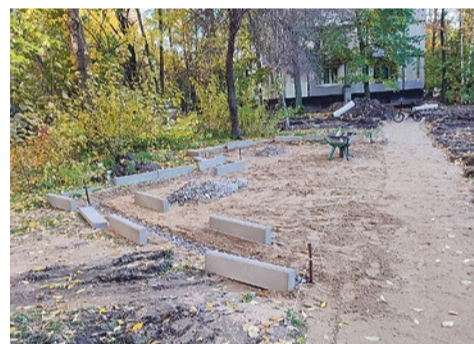
Строительство зоны отдыха на Софийской, 35/4

В 2022 году здесь были проложены новые асфальтированные пешеходные дорожки площадью 636 м 2 , обустроена площадка из гранитной крошки площадью 42 м 2 , на которой установили шезлонги и скамейки со столом, было высажено 143 кустарника (барбарис, спирея) и 11 деревьев (яблоня декоративная, ива ломкая, ель колючая), восстановлен газон на площади 639,2 м 2 . В 2023 году озеленение сквера будет продолжено.