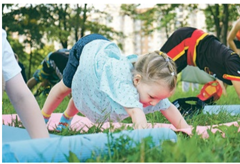
Фитнес в парке Интернационалистов

Муниципалитет № 72 выступает за то, чтобы каждый житель округа занимался физической культурой, подходящей ему по возрасту и по состоянию здоровья.