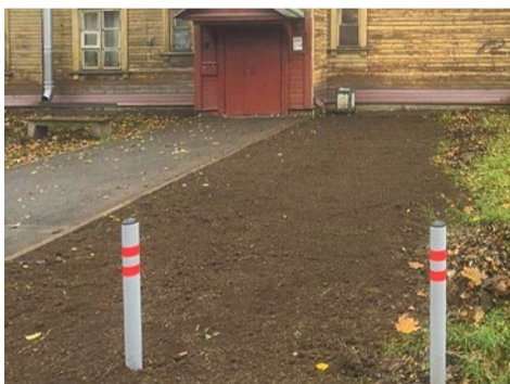
Восстановление газонов на Фарфоровском посту и на Южном шоссе

В программу восстановления газонов вошло семь адресов: Южное шоссе, 64, проспект Славы, 52/1, Софийская улица, 35/1, Бухарестская улица, 86, Фарфоровский пост, 68, Фарфоровский пост, 70, Пражская улица, 25.