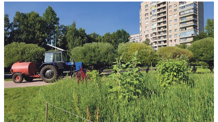
Полив растений в засуху в Ивовом сквере на Пражской, 25