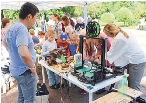
Экопраздник в сквере на Бельи Куна, 9/1

Большое внимание муниципалитет уделяет экологии и экологическому просвещению. На экскурсии по биоразнообразию парка Интернационалистов жители узнали особенности разных растений и травянистых сообществ родного парка. Традиционный праздник «Экодвор» стал ярким событием, на котором гости познакомились с практикой раздельного сбора отходов и формирования экопривычек.