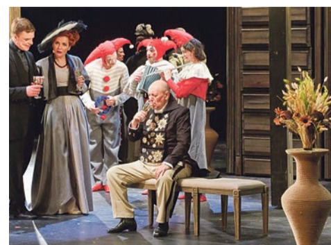
Спектакль в театре «БУФФ»

совместной работы фигуристов мировой величины, выдающихся хореографов, талантливых композиторов, дизайнеров и декораторов. Двухчасовой насыщенный эффектами спектакль понравился и детям, и взрослым красочными костюмами, трюками и захватывающим сказочным сюжетом и звездным составом.