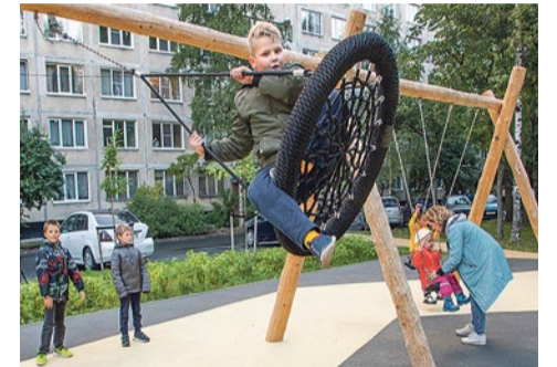
Открытие площадки на Бухарестской, 86

За два года общая сумма расходов на строительство детской площадки, озеленение и ремонт пешеходных дорожек составила 13,953 миллиона рублей.